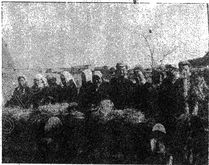
• 沈連仲合作組全體組員收穫時情形。