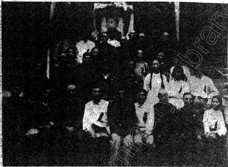
長春市天主教愛國會新選委員合影

結在政府和革新會的周圍，認真學習和討論憲法草案，更深入一步地展開反帝愛國運動，同時更要警惕帝國主義分子和反革命分子的新陰謀，徹底肅清教會內的帝國主義思想影響，作好愛國愛教，辦好中國教友自辦的宗教事業。