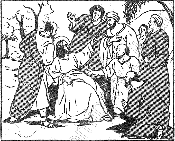
• 耶穌與法利賽人談守齋 •

怒氣填胸的自以為理真氣壯，向耶穌聲色俱厲的質問說：「若翰的門徒們常守大齋，並遵行一切的禮規，法利塞的弟子們也常這樣作，爲什麼惟獨你的門徒們大吃大喝的不遵守齋戒呢？」