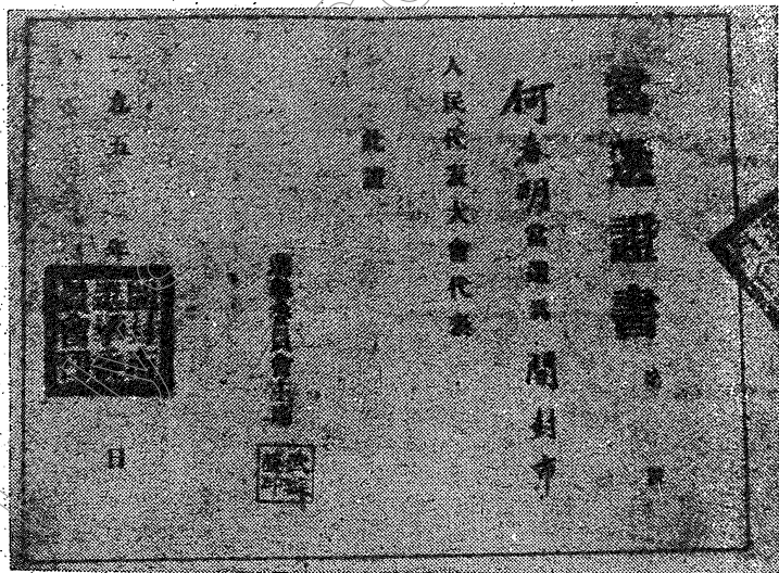
• 何春明代理主教的當選證書 •

我既當選為人民的代表，就負担起人民所交給的任務，以實際行動來報答人民對我的愛戴和要求。同時我又是個宗教職業者，教區的負責人，教區中的中國神父及廣大教友也在要求我向愛國愛教的光明大道上和大家一齊邁進。這雙重任務我全要負担起來。今後更要與本教區的各位中國神父及廣大的教友們團結一起，共同努力深入的繼續開展反帝愛國運動，從而提高思想覺悟和全國人民緊密的站在一起，（下接第三十五頁）