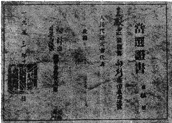
• 王殿君教友當選為同族自治區代表的證書 •