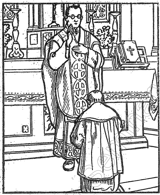
神父轉身降福教友。教友們該低下頭，請聖號。（在黑彌撒中，神父不降福。）

衆人說：「 Ite Missa est 」這句話普通都解作「彌撒完了，你們走吧！」但這句話的來歷即與「彌撒」二字的起源有了關係。按拉丁文來講，這三個字的原意是：「走吧，打發你們回家了！」（注意「打發」二字）古時在聖祭中也說這句話，