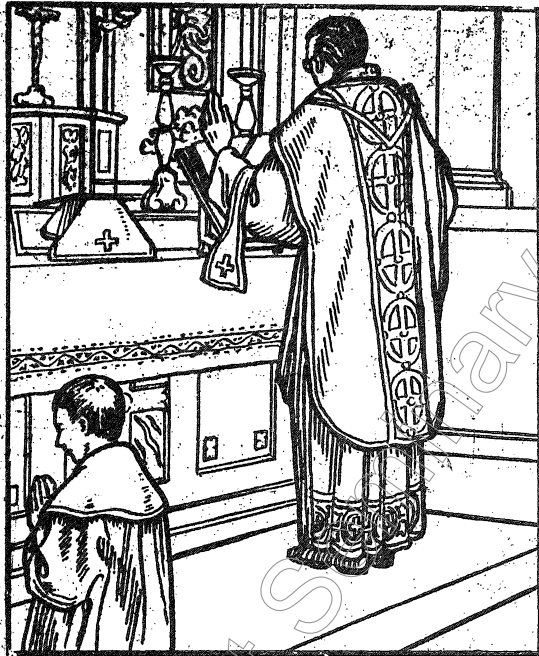
神父收拾完聖爵後，至祭台右邊念經 ——謝聖體經。