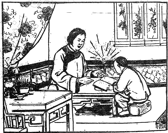
(三) 相伯先生的母親娘家姓沈，在相伯先生小時，她就教他念書，念要理。