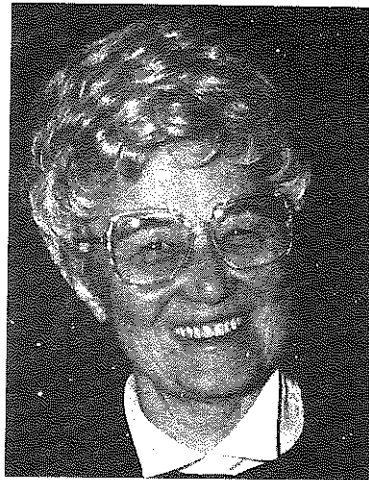
盧嘉勒 ( CHIARA LUBICH )